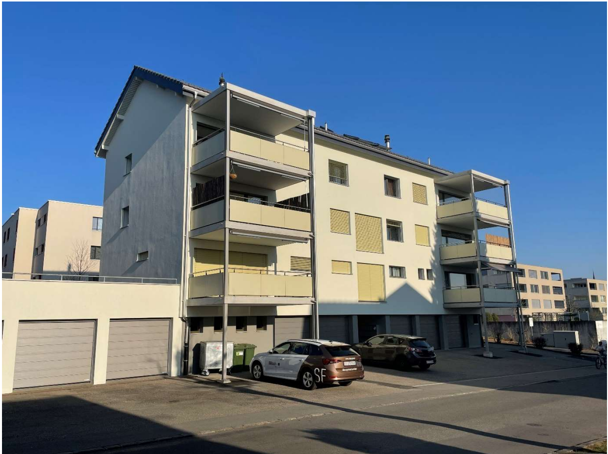
Bellevuestrasse 32, Hochdorf: aktuellste abgeschlossene Sanierung der KAB Wohnraumgenossenschaft. Lesen Sie mehr dazu auf Seite 3.