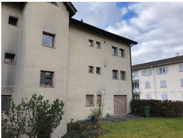
Ebenfalls vor der Sanierung

Im Zuge der anstehenden Sanierung sollen folgende Bauteile saniert werden: