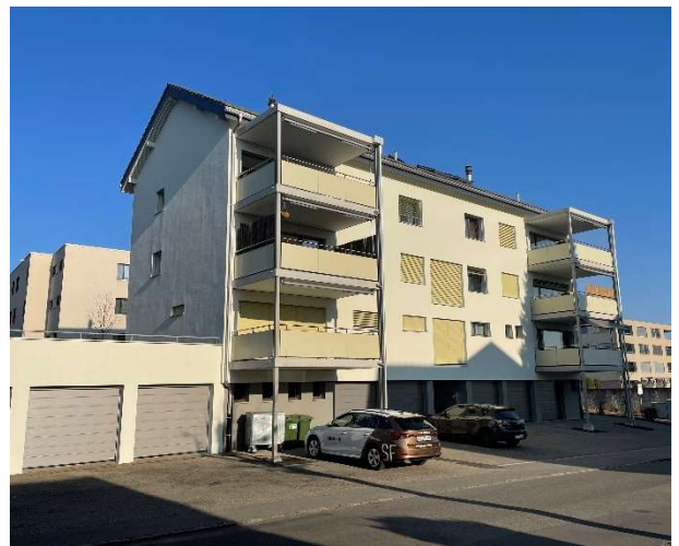
Nach der Sanierung

Die Bauarbeiten konnten pünktlich im Mai 2021 mit den Gerüstarbeiten und der Montage der neuen Balkone starten. Die Arbeiten kamen termingerecht voran, wodurch ab Juli 2021 mit dem Innenausbau gestartet werden konnte. Infolgedessen, dass sämtliche Mieterinnen und Mieter während der Sanierung die Wohnungen weitgehend nutzten, bedeutete dies für alle Beteiligten eine zusätzliche Herausforderung. Ende Oktober konnte das Bauvorhaben an Hubert Aregger in seiner Ganzheit übergeben werden.