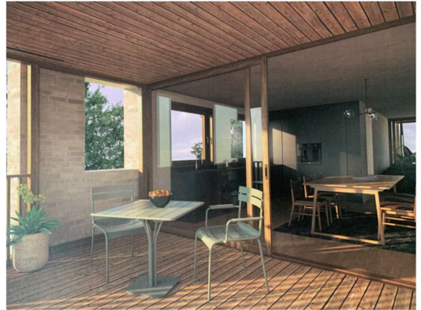
Sicht in eine geplante Wohneinheit

Der Baustart wurde auf das Frühjahr 2023 terminiert. Geplant sind neu 24 Einheiten bestehend aus Studios; 2 ½-; 3 ½-; 4 ½- und 5 ½ -Zimmer-Wohnungen. Das Interesse an den neuen Wohnungen an dieser großartigen Lage ist sehr gross, sind doch seit der öffentlichen Auflage bereits viele Anfragen eingegangen.