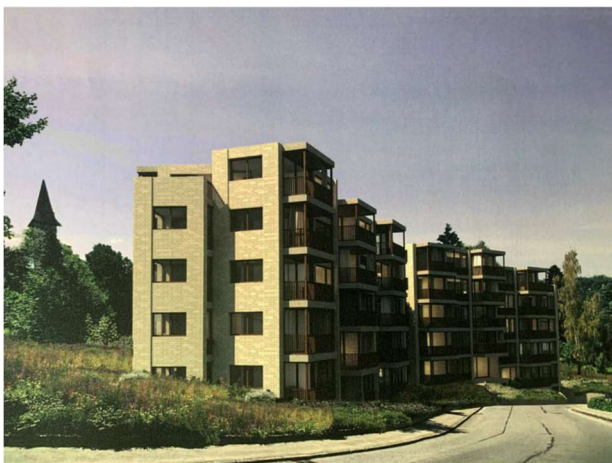
Visualisierung der geplanten Baukörper

Nach dem Vorliegen der verschiedenen Studien und einem Vorprojekt beschloss der Vorstand der KAB WRG, dem Büro Dolmus Architekten AG den Auftrag für die Erstellung von zwei Neubauten zu erteilen. Da in der Stadt Luzern das neue Bau- und Zonenreglement im Herbst 2022 in Kraft treten wird und dadurch leider bis vier Wohnungen weniger erstellt werden könnten, wurde das Projekt gemäss dem momentan geltenden Bau- und Zonenreglement ausgearbeitet. Die Baubewilligung muss jedoch bis spätestens Herbst 2022 vorliegen.